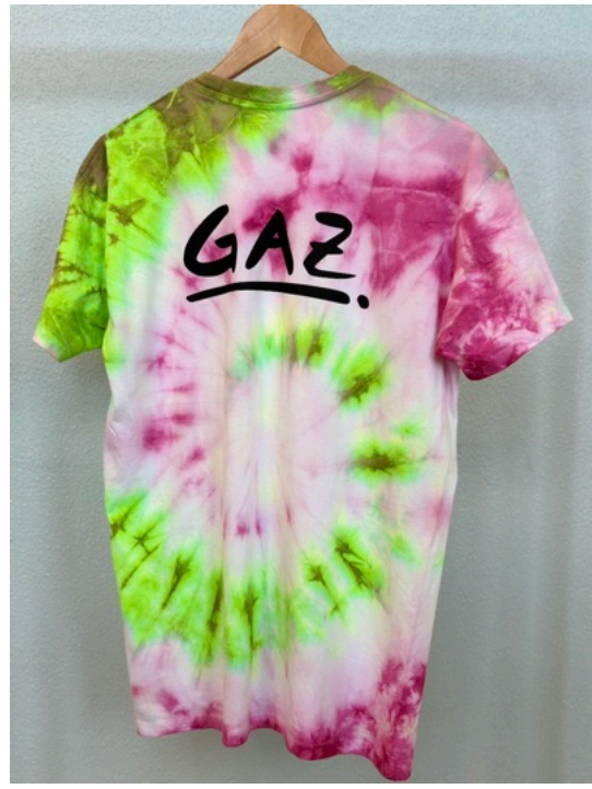
GIFT (Größe M)