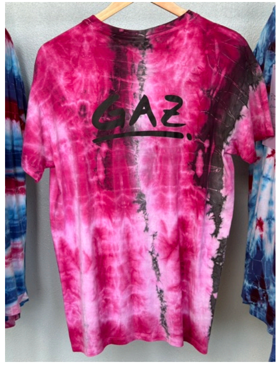
ROSI (Größe M)