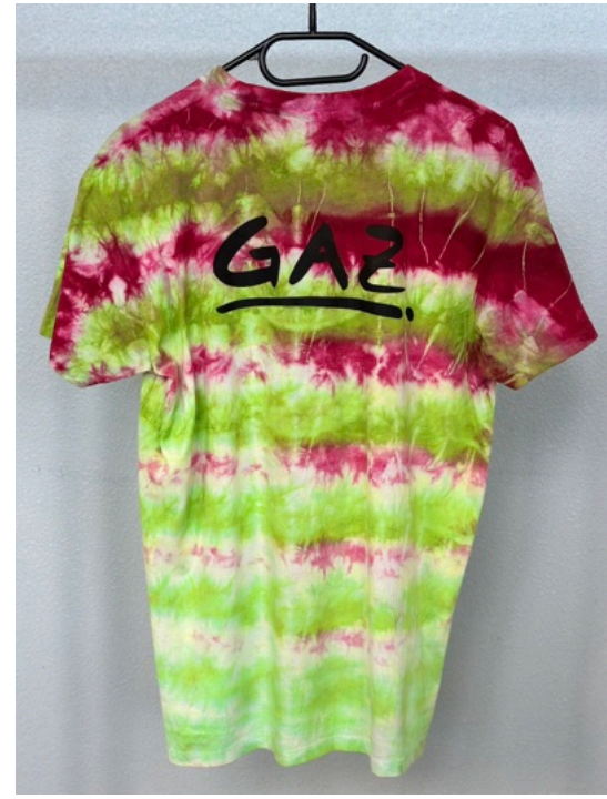
ALOHA (Größe M)