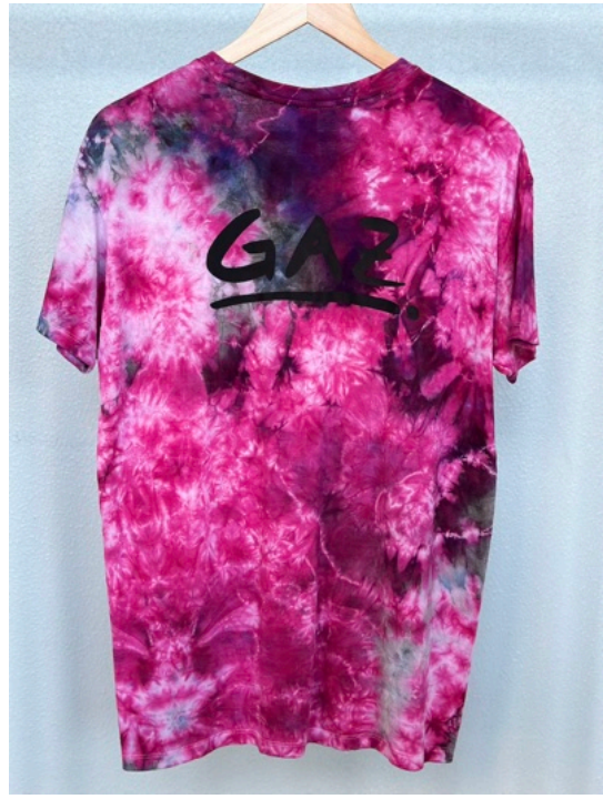
RADIESCHEN (Größe M)