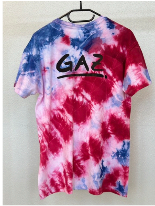
SKY (Größe M)