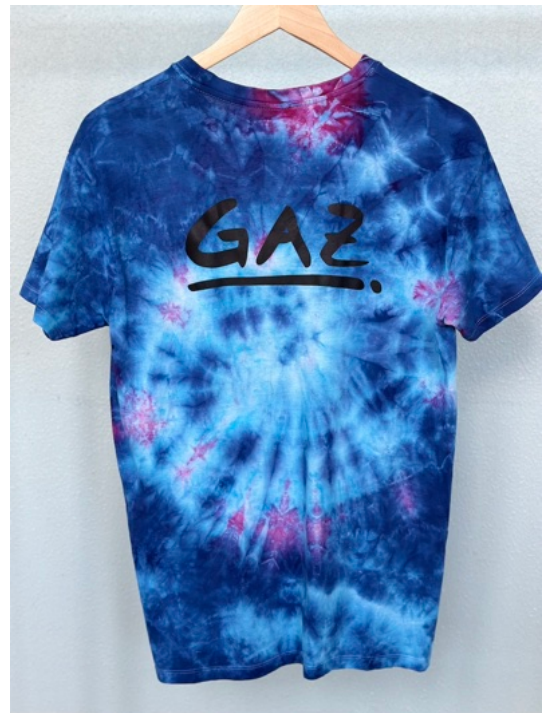
TV GIRL (Größe S)