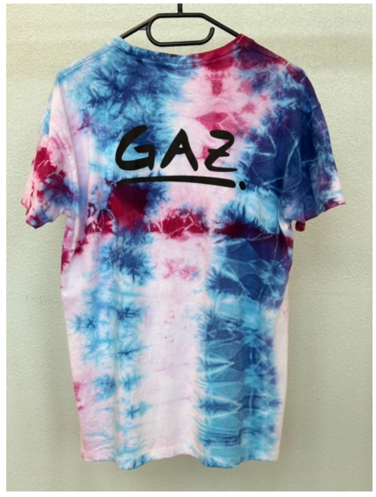
POLAR LIGHT (Größe M)