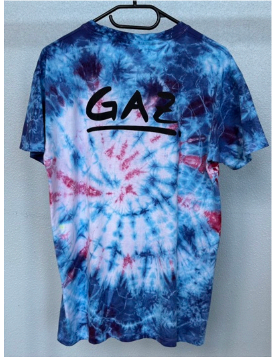
RED BLUE SEA (Größe M)