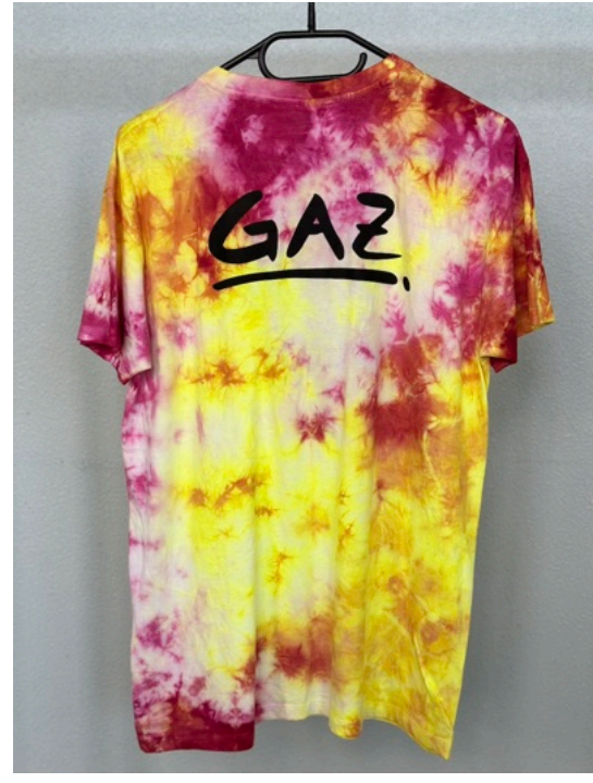
PINK LEMON (Größe M)