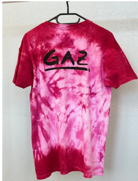
PINKY UNICORN (Größe M)