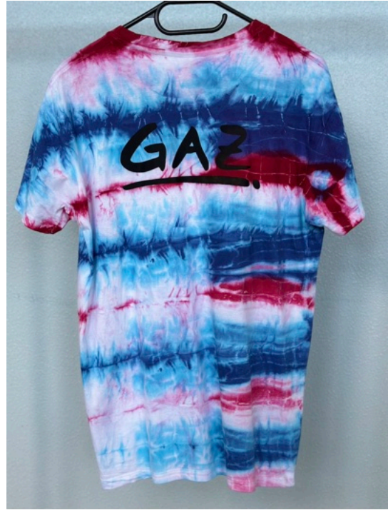
MIRRORBLUE (Größe M)