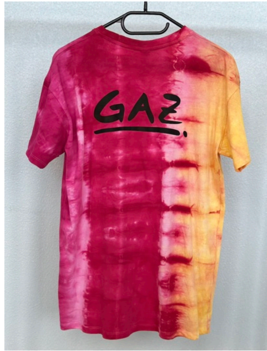
SUNSET (Größe M)