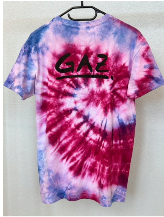
MUSCHELBUNT (Größe M)