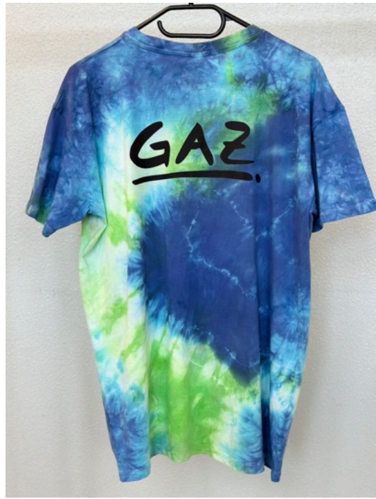
BLUE SHINE (Größe M)