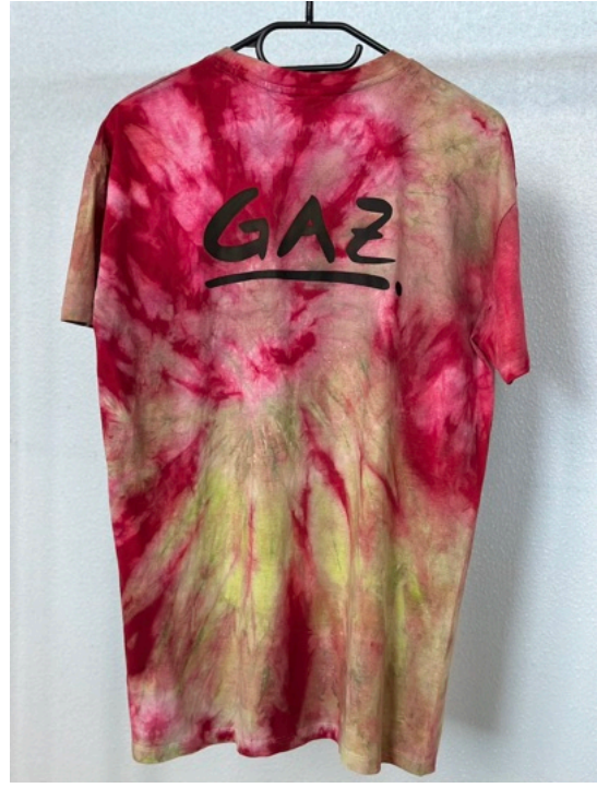
RHABARBER TIME (Größe M)