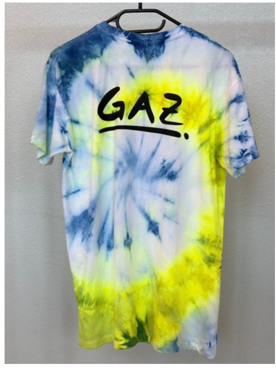
BLUE LEMON (Größe M)