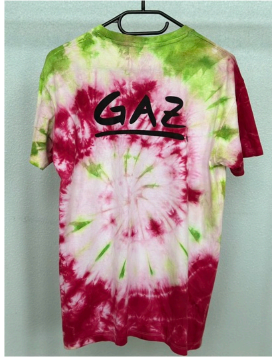
GREENBERRY (Größe M)