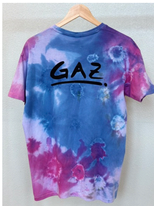
AQUARA (Größe M)