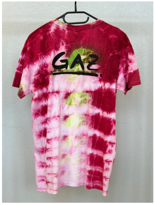
BERRY MIX (Größe M)