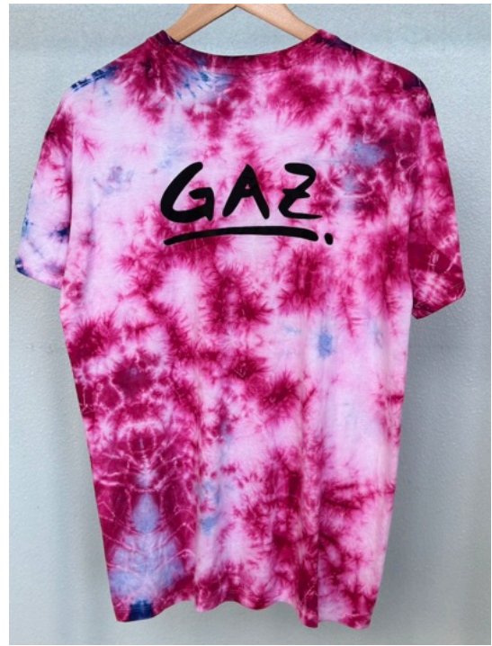
BLUE PINKY (Größe L)